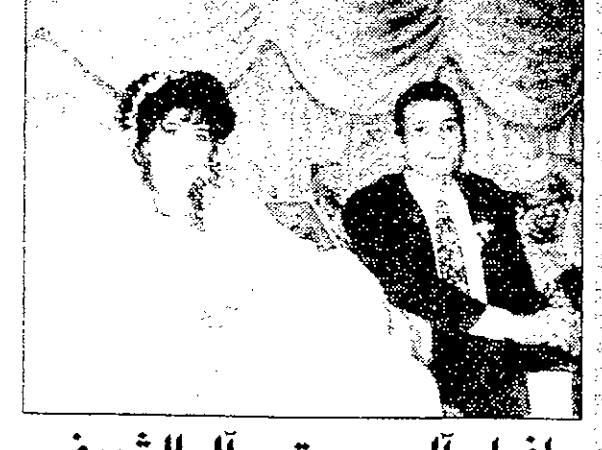
افراح آل جبعتي وآل الشريف